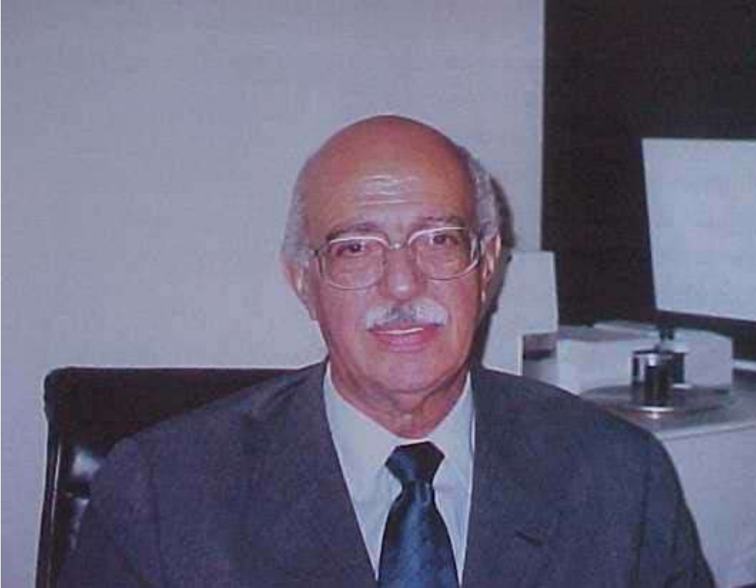
Prof. Dr. Adib Domingos Jatene